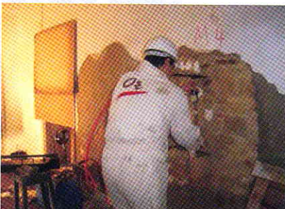
Ensaio de macacos planos numa parede: medição de deslocamentos com alongâmetro. Flat jack tests: measurement of strain.

Elaboração de planos de manutenção de edifícios Maintenance planning for buildings