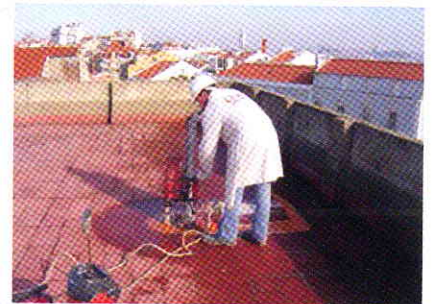
Extracção de carote na laje de cobertura de um edifício, para caracterização do material. Core extraction from building's roof layer in order to characterise the material.

DIAGNOSTICAR ANTES DE INTERVIR DIAGNOSE BEFORE TAKING ACTION