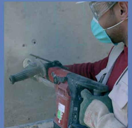
Recolha de pó do betão a diferentes profundidades para determinação do perfil de cloretos