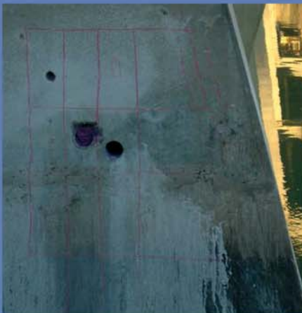
Zona de ensaios com as malhas de armaduras levantadas com o pacómetro (medição do recobrimento)

A Figura 1 ilustra, graficamente, a confrontação entre os resultados da medição com o pacómetro, do recobrimento das armaduras e o valor médio dos resultados da profundidade de carbonatação do betão em várias zonas de ensaios (no caso, em vigas de um tabuleiro). É possível verificar que as frentes de carbonatação, traduzidas pelas linhas verticais (face lateral e face inferior), em termos médios, encontram-se perto das armaduras (início da propagação da corrosão). Do ponto de vista da verificação da conformidade dos requisitos de durabilidade, este tipo de representação permite, ainda, avaliar a percentagem dos valores de