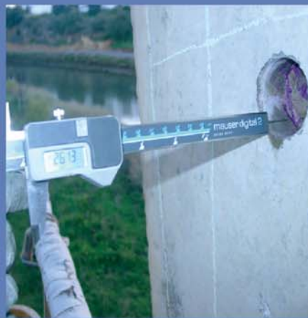
Medição da profundidade de carbonatação do betão após aspersão da solução alcoólica de fenolftaleína