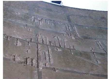
Corrosão de armaduras com delaminação de betão