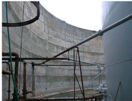
Vista interior da bacia de retenção