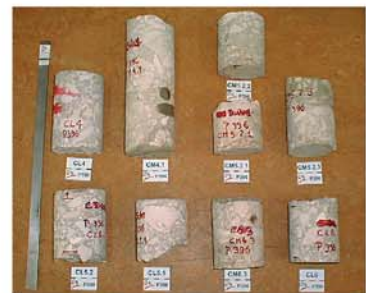
Amostras extraídas para ensaios de avaliação da resistência mecânica