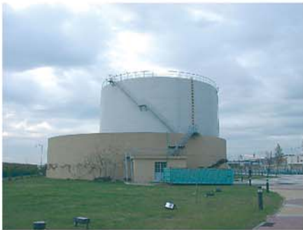
Vista exterior do reservatório e bacia de retenção