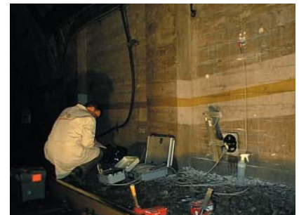
Figura 3 - Medição de intensidade de corrosão e do potencial eléctrico das armaduras numa zona de ensaios localizada na parede lateral no túnel.

com outros parâmetros como, por exemplo, o potencial eléctrico das armaduras, a resistividade eléctrica do betão, a humidade relativa e temperatura ambientes (Figuras 3 e 4). A informação recolhida permitiu ao dono de obra decidir sobre a necessidade de implementação de medidas correctivas, face ao estado actual de conservação das estruturas das estações, de modo a