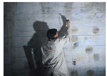
Figura 4 - Medição da resistividade eléctrica do betão noutra zona de ensaios.

não comprometer as importantes obras de remodelação previstas. Por outro lado, a informação recolhida, permitiu, também, a definição da estratégia de manutenção - conservação a empreender de forma a prolongar o tempo de vida útil das referidas estruturas.